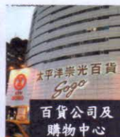
百貨公司及 購物中心